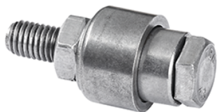
WYCINAK DO OTWORÓW 632223